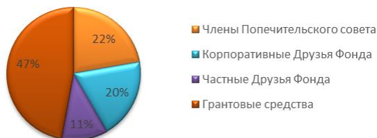
Источники поступлений средств в 2017. Схематично